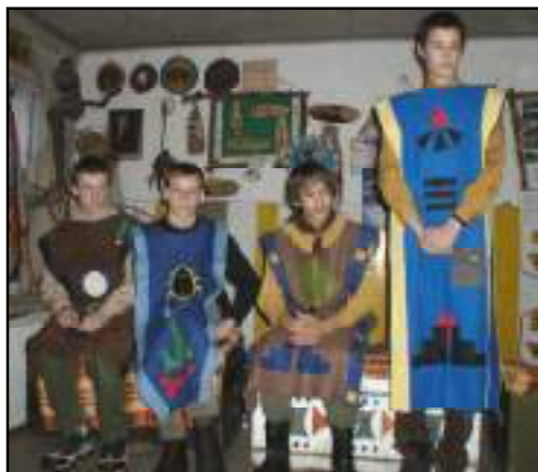
Zpěv rádce rodu Viků Plamínka, zprava sedí Tarzan, Brouček a Dráček