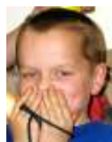
Akční hrdina Vlč

Otočte na další stranu, tady již nic není.