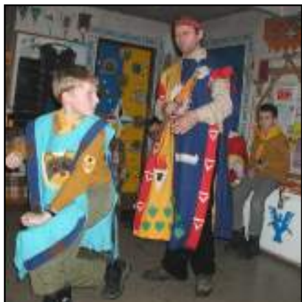
Bědovi je Šamanem MIČKINIKWOU slavnostně udělena hodnost Vanata

úryvek z básně Máj. Pak nastoupil Mona, který si na poslední chvíli vzpomněl na Cestičku k domovu. Ovšem pak nastoupil Šmodrch se svým Vodníkem a ostatní neměli šanci.