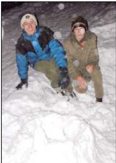
Mauglí, Brouček a jejich hrad

Zahajovačka tedy začala klasicky v 16.00. První se ujal programu Mlčím. Měl připravenou spoustu zajímavých her, ve kterých jsme byli všichni rozdělení na skupiny a v těch se soutěžilo. Druhou část měl na starost Křeček a hrála se hra připomínající staré známé Bingo. Poté se ujali slovo Tarzan s Cestovatelem, kteří letos připravují etapovku. Konala se etapa –