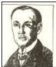
Karel Čapek – světově proslulý dramatik, spisovatel, a také novinář. Hrou RUR daroval světu slovo ROBOT.