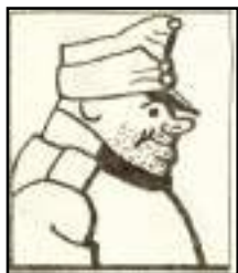
Dobry vojak Švejek

Jména jako Janáček, Foerster, Martinů, O. Nedbal, J. Kubelík či Talich a další jasně hovoří o kvalitě hudebního umění té doby. Stejně bychom mohli vypočítávat třeba malíře: Švabinský, Filla, Šíma, O. Nejedlý, Zrzavý, Špála, ale nedopočítali bychom se. Svého vrcholu a opravdu evropské úrovně dosáhla za 1. republiky česká literatura. Jak poezie – třeba předčasně zemřelého J.