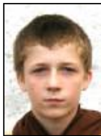
Tři nejlepší v loňské Javorové nažce