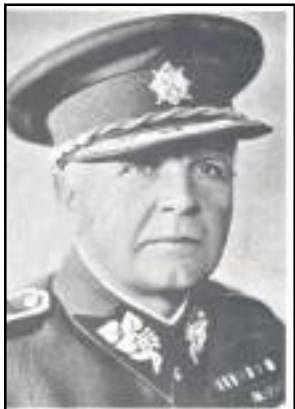
Přednosta Ředitelství opevňovacích prací divizní generál K. Husárek

Minule jsme si řekli, že vzhledem ke špatné mezinárodní situaci se představitelé našeho státu rozhodli řešit způsob jeho obrany před případným vpádem cizích vojsk. V roce 1935 se rozběhla rozsáhlá a zcela zásadní modernizace armády a společně s ní na hranicích Československa rovněž výstavba mohutného systému opevnění.