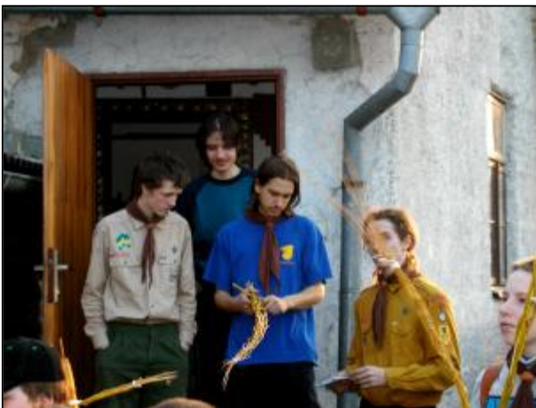
Tarzan se svojí superpomlázkou. Přihlíží Drak

Potom jsme uklidili, zakončili kmenovou lelawatikou a rozešli se do svých domovů. Po akci byla na klubovně ještě kmenová rada.