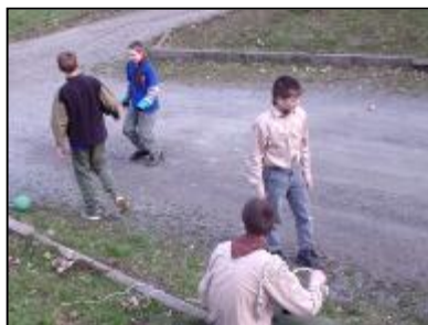
Část družiny při plnění OP