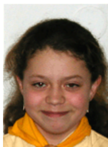
Na fotkách vidíte nový přírůstek družiny Káňat