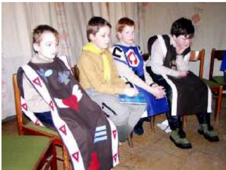
Káňata ještě ve starém složení na 63. sněmu