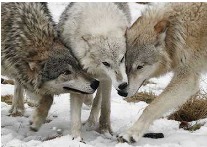
Smečka vlků (Šmodrch, Netopýr a Dušan) na družinovce se radí, jak dál© pozn. red.