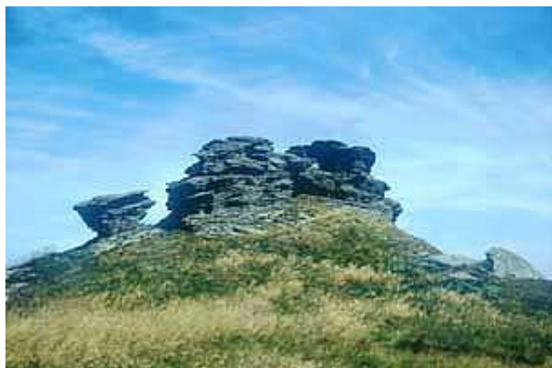
pohled na Petrovy kameny od Pradědu

Petr hledal Lidku, aby jí vyřídil neradostný vzkaz. Když ji nikde v domě nenašel, pochopil, že dcera už přání Bély zná. Šel ji proto hledat do lesa. Chodil, volal, ale Liduška se neozývala. Potom ji našel. Ležela tichounce uprostřed zeleného kapradí, jakoby spala. Petr hořce zaplakal a přísahal strašlivou pomstu. Vydal se hned na cestu, našel Bélu a zabil ho. Věděl, že se nemůže vrátit domů, utekl proto do hor a schovával se ve skalách. Žil v jeskyni, živil se sběrem lesních plodů, občas něco ulovil. Neměl žádné zásoby a zima se blížila.