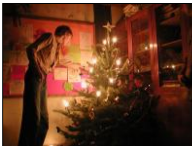
Běďa zapaluje jednu ze 13 svíček

Za okny se ale pomalu sešeřilo a čas zábavného programu byl kolem šesté hodiny uzavřený několika koledami našeho hudebního tělesa, i když pravda, nějakou tu zkoušku by to ještě chtělo. Každopádně nyní už byla na řadě nejslavnostnější chvílka. Pod stromečkem se objevily dárky a začalo zapalování 13 svíček. Byla řečena spousta krásných slov, zářící stromek byl taky moc pěkný a tak mezi početné osazenstvo začali rádcové rozdávat velkou hromadu dárků, která se letos sešla. Myslím, že na každého se dostalo, protože každý, kdo tu byl si