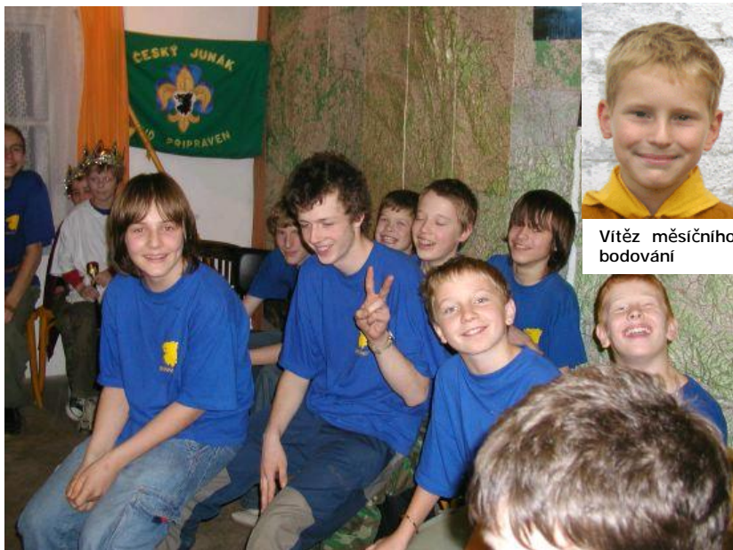
Vítěz měsíčního bodování

Vánoční nadílka je jednou z neočekávanějších akcí. A o zábavu, jak ukazuje „vysmátý“ rod Káňat při přesedávané, nouze taky nebývá.