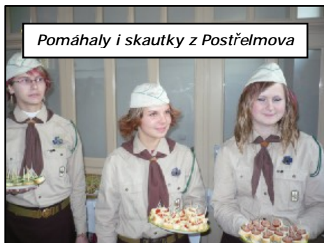
Pomáhaly i skautky z Postřelkova

Vernisáž výstavy je akcí, kterou tedy náš oddíl ještě nikdy nepořádal a v plánech akcí skutečných oddílů rozhodně obvyklá není. Možná tím spíš už bylo na čase takovou neokoukanou akci uspořádat a letošní skautské světové jamboree k tomu bylo výbornou příležitostí. Po jamboree (o kterém jste si mohli přečíst v minulé Kůře) se totiž pořádá putovní výstava fotografií z této akce po městech České republiky a Zábřeh je mimochodem zatím jedinou zastávkou této výstavy v okrese Šumperk.