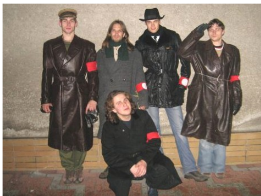
Převleky gestapáků byly skvělé