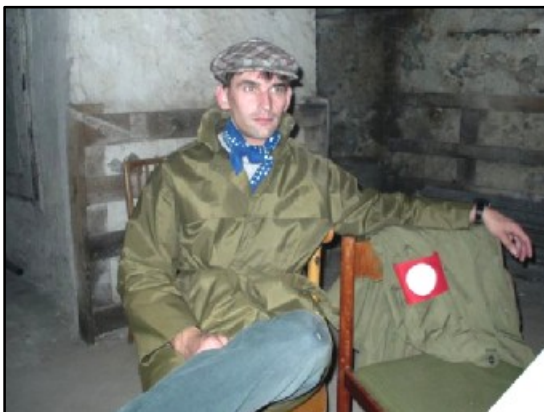
Konfident a současně „zrádce“ Mot ve svém spikleneckém podzemním doupěti

Nebudu popisovat průběh Operace, kdo zažil, ví o čem je řeč. Po téměř čtyřech hodinách od startu první skupinky byla Operace Hohenstadt ukončena na Rudolfově vyhlášením výsledků a předáním cen. V kategorii mladších zvítězila Zlatá Lilie a ve starší kategorii zvítězili kluci z Olšan. Wašte! Kluci z Olšan jako jediní splnili celé zadání – nejenže dokázali partyzány kontaktovat a předat jim zašifrovanou zprávu, ale také se jim podařilo odhalit zrádce v odbojářské síti pracujícího pro Gestapo.