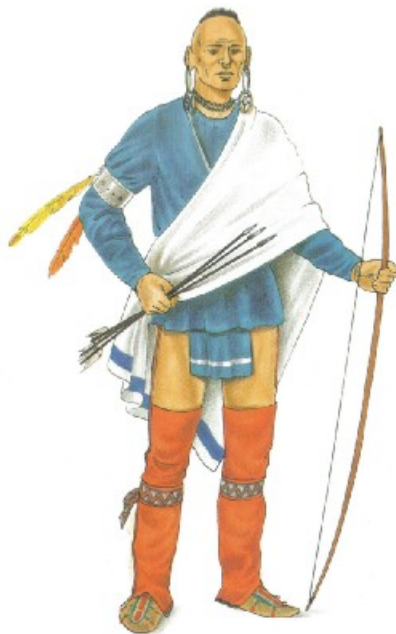
In the style of Joseph Weller, 1796.