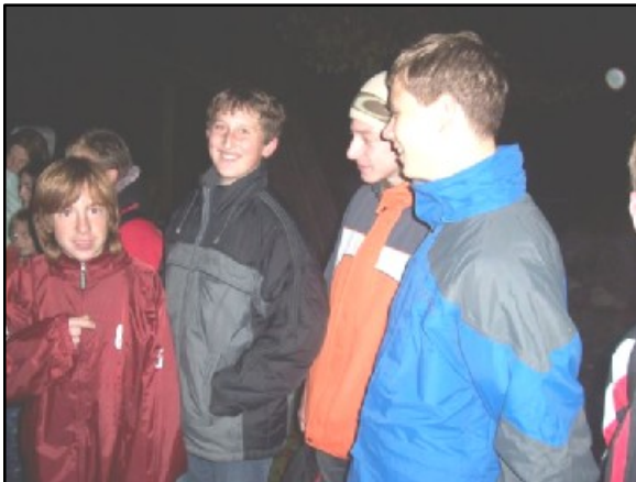
Celkově vítězná hlídka kluků z Olšan