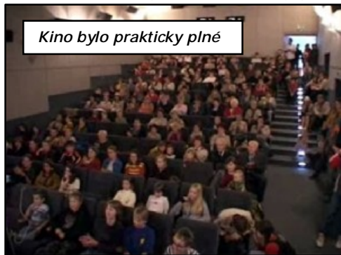
Kino bylo prakticky plné

improvizace na místě, nakonec se to myslím moc povedlo. Ropák a holky z Rozrazilu v galerii chystali jednohubky a další obcerstvení a po třetí hodině se sešli všichni, co měli vystupovat, aby se naposledy probral program vernisáže.