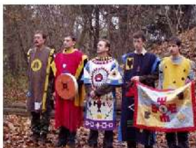
Fotika ze zahájení „kláně rodů“ před naším dno 8. listopadu 2008 (Wyominia, Mot, Měčinkawa, Dvak, Třpyyynh)

měsíční časopis kmenového kmene VLČÍ LASKA JIHLAVY / AŽDŮ U ústí do Šumy jako dodatku ročníku přílohám karmadám... Číslo 200 / 20. ročník