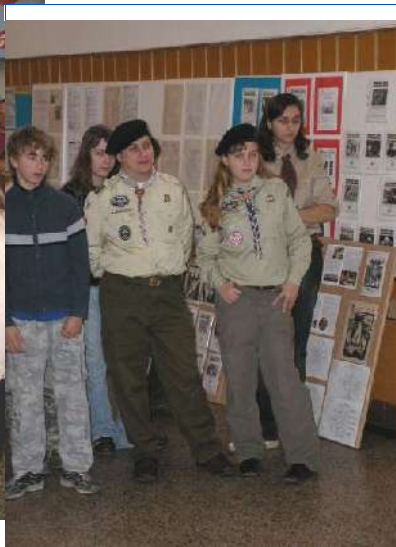
Výstava časopisů v DDM - hosté