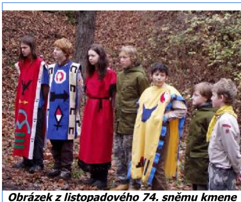
Obrázek z listopadového 74. sněmu kmene

Rok 2009 dokončí úsilí mnoha členů a příznivců na vybudování WC – nedávno se mi připomínali Svišť a Sýček – firma na sádrokartony – že dodrží svůj slib a udělají vše zadarmo. Jsem rád, že kluci i po 20 letech nezapomínají a hlásí se takto ke svému dětství v kmeni Shawnee. Čeká nás ještě hodně práce, ale klubovna bude mít, co už dávno potřebuje. Tady bych rád poděkoval Waopemu a Wablautanagovi za čas, práci a peníze, které do tohoto projektu vložili.