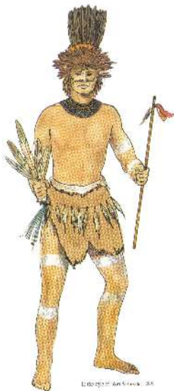
Bojovník kmene Chumasch

V oblasti Columbijské Plošiny lovili rybáři jiným způsobem. K lovu si pečlivě vyhlédli místa, kam se hejna každoročně vracela, aby se tu ryby třely. Lovci si vyznačili nejužší místa pomocí kamenů a bílých oblázků, aby mohli dobře sledovat nenápadný třpyt lososa plujícího proti proudu. V některých oblastech zřizovali rybáři dřevěné hráze.