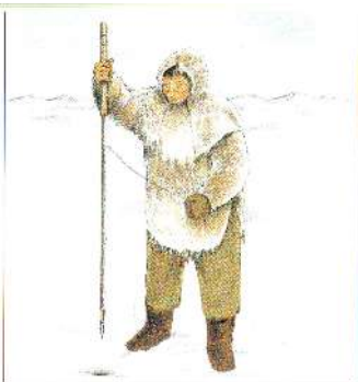
Inuitský lovec při lovu tuleňů

Lovci se však vydávali i dále na otevřené moře, aby lovíli vorvaně, narvaly a sviňuchy. Tento lov se však neobešel bez větší lodky zvané umiak. Umiak byl člun dlouhý asi 10 metrů a byl vyrobený z velrybí kosti nebo z kůže. Inuité na nich pluli ve skupině 40 až 50 lidí, včetně dětí a asi 15 zkušených lovců. Neměli žádného náčelníka – celý lov si bral na starost lovec ze všech nejzkušenější.