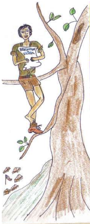
Březová kůra se čte zkrátka všude!