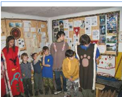
Ještě jedna fotka ze 74. sněmu