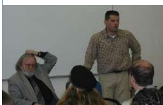
Hiawatha a Tahoanah - křest nové knihy a beseda