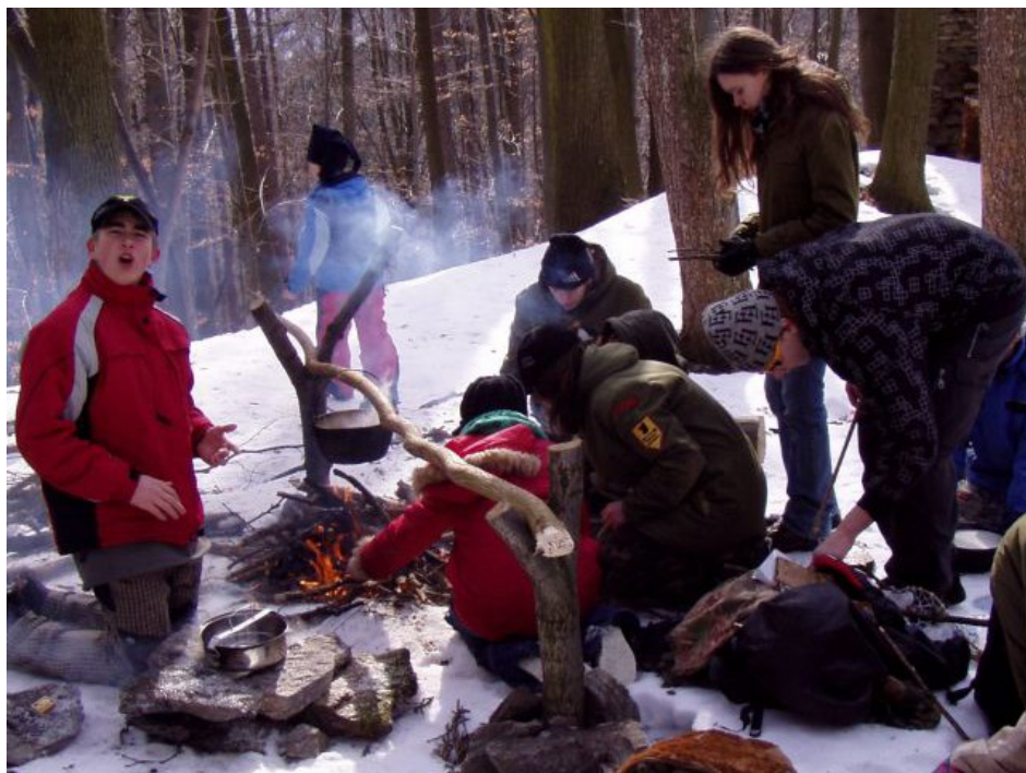
Vaření na Novém Hradě, 6. 3. 2010